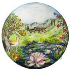
Materialien aus der Frauenarbeit in der EKBO

Der Auszug aus dem Hohelied inszeniert Körper, Schönheit, Lust und Sinnlichkeit in einem Rausch an poetischen Bildern. Im weiteren Kontext geht es aber auch um Geschlechterbeziehungen auf Augenhöhe, um Versuche, das Weibliche zu kontrollieren, um Sehnsucht, Liebe, Lebendigkeit und Tod. Besonders spannend sind die vielfältigen feministisch-theologischen Entdeckungen und die queer-theologischen Fragen an den Text sowie seine Verknüpfungen mit dem alttestamentlichen Kanon und mit antiker Liebesdichtung. In der Vorbereitung des Frauensonntags werden diese Perspektiven geistlich und sinnlich erfahrbar.