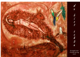
Arbeitshilfe zum Frauensonntag des Fachbereichs Frauen im Evangelischen Zentrum Frauen und Männer gGmbH

Wir haben uns entschlossen, auf facebook Präsenz zu zeigen. Suchen Sie uns, vernetzen Sie sich, verbreiten Sie unsere Nachrichten.