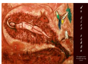
Arbeitshilfe zum Frauensonntag des Fachbereichs Frauen im Evangelischen Zentrum Frauen und Männer gGmbH

Ort: Campus Daniel, Brandenburgische Straße 51, 10707 Berlin Kosten: 20,00 Euro, Infos und Anmeldung hier