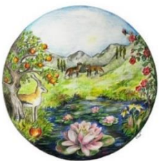
Materialien aus der Frauenarbeit in der EKBO, Bild Els van Vemde

»Du bist schön« (Hohelied 1, 15 – 2, 17). Zum Auftakt des bundesweiten Evangelischen Frauensonntags – in der EKBO Mirjamsonntag - feierten wir einen zentralen Radiogottesdienst in Hamburg . Theologisch lag der Fokus auf Schönheitsidealen gestern und heute: Was heißt überhaupt Schön-Sein? Was können Worte und Blicke, mit denen wir unseren Körper und den anderer wahrnehmen, bewirken - positiv wie negativ? Und. Mit welchen Augen schaut Gott uns an? Der musikalische Bogen reichte von Gerhard Tersteegen bis Sarah Connor. Hier können Sie ihn nachhören und teilweise auch nachlesen: https://rundfunk.evangelisch.de/kirche-im-radio/dlf-gottesdienste/du-bist-schoen-10153