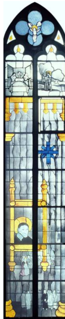
Vinzent von Paul: Die Kranken besuchen