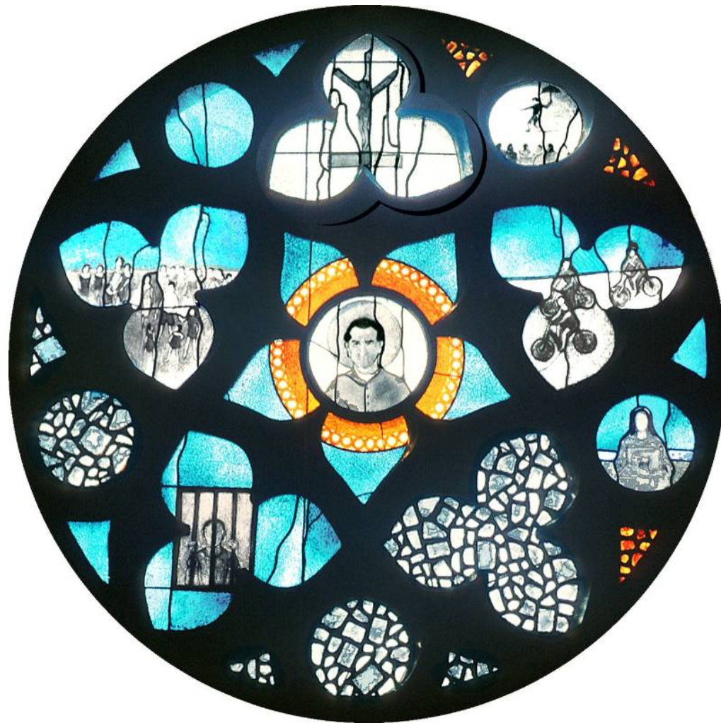
Johannes Don Bosco: Die Fremden beherbergen