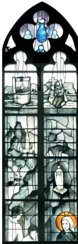
Konrad von Parzham und Bernadette von Lourdes: Die Durstigen tränken