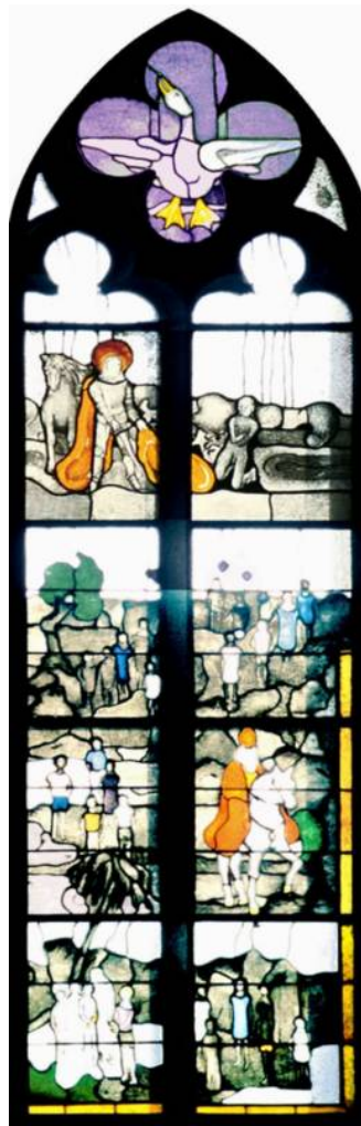
Martin von Tours: Die Nackten bekleiden