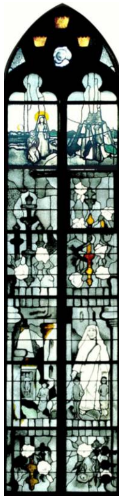
Elisabeth von Thüringen und Mutter Teresa: Die Hungrigen speisen