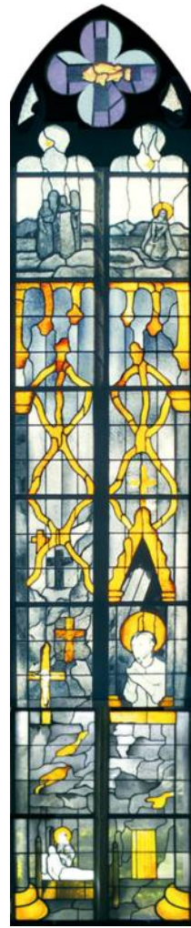
Tobias: Die Toten begraben