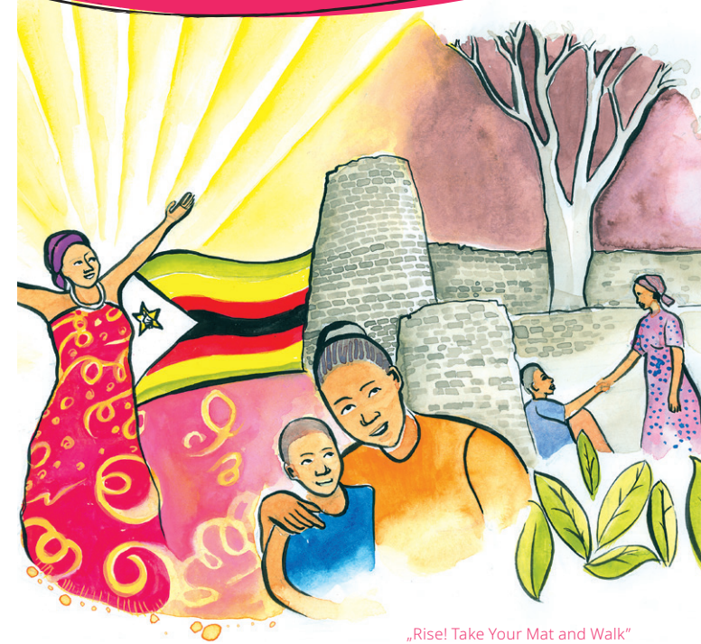
„Rise! Take Your Mat and Walk“ © Nonhlanhla Mathe