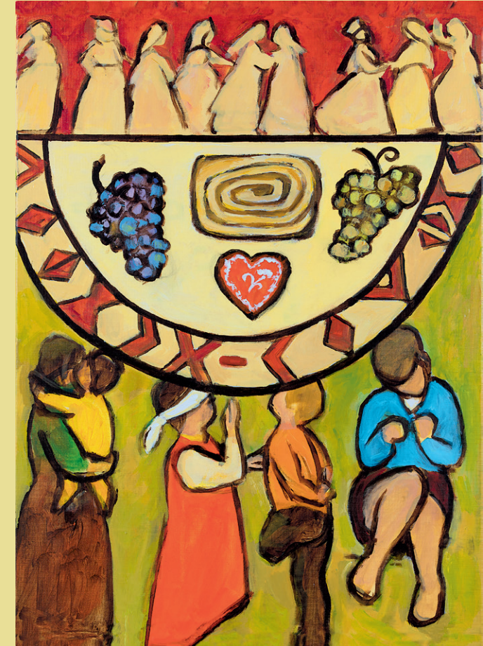
Come – Everything is ready , Rezka Arnuš, © Weltgebetstag der Frauen – Deutsches Komitee e.V.

© Weltgebetstag der Frauen – Deutsches Komitee e.V.