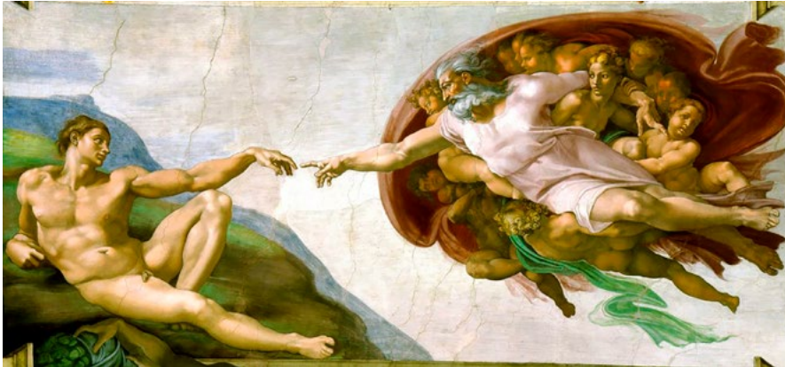
„Erschaffung Adams“ von Michelangelo Buonarroti. Das Gemälde gehört zur Sixtinischen Kapelle in Rom und wurde zwischen 1508 und 1512 gemalt.