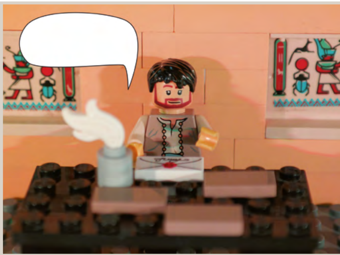
Abbildung 1 Lk 1 aus der Berliner Bibel