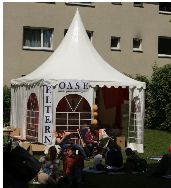
Elternoase beim DEKT 2017 in Berlin