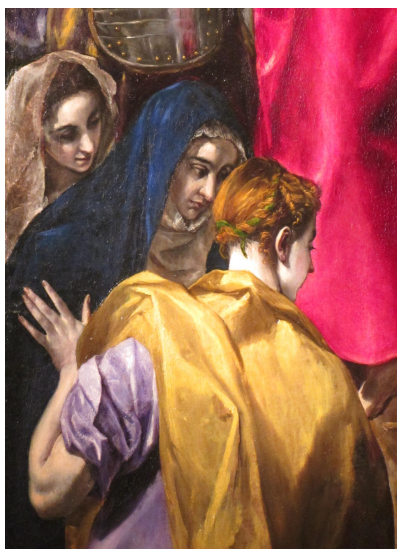
El Greco, Toledo/Spanien

Beim Kreuz Jesu standen aber seine Mutter und die Schwester seiner Mutter, Maria, die Tochter des Klopas, und Maria aus Magdala (Joh 19)