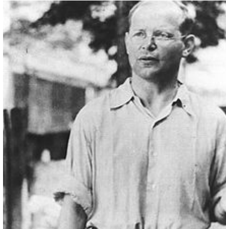
Dietrich Bonhoeffer in Tegel